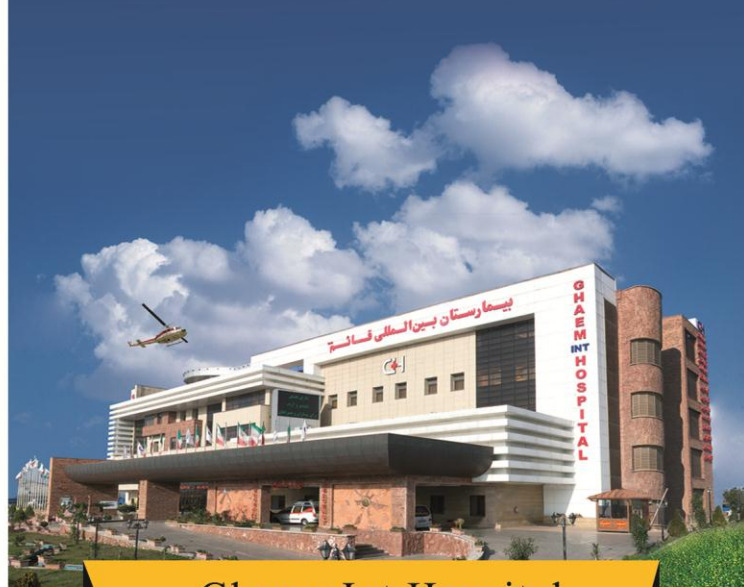
Ghaem Int Hospital